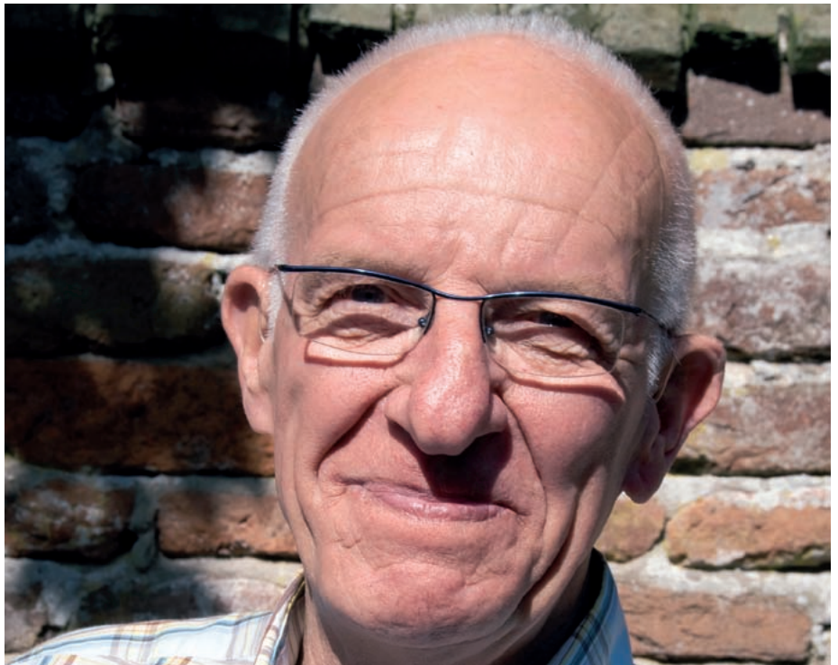
Lebensfreude «Dank meinen Mini-Hörgeräten kann ich endlich wieder mitreden.»

Seit ich wieder gut höre, bin ich richtig aktiv geworden. Ich treffe mich wieder mit Freunden, führe lange Gespräche und kann auch den Frühling voll und ganz geniessen. Ich würde auf die Hörkorrektur nicht