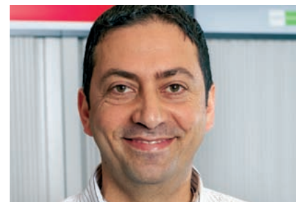
I. Kaspari lädt bis Mitte Juni zum Hörtest ein.

Informationen zu den Filialen gibt es unter 0800 800 881 oder auf www.amplifon.ch .